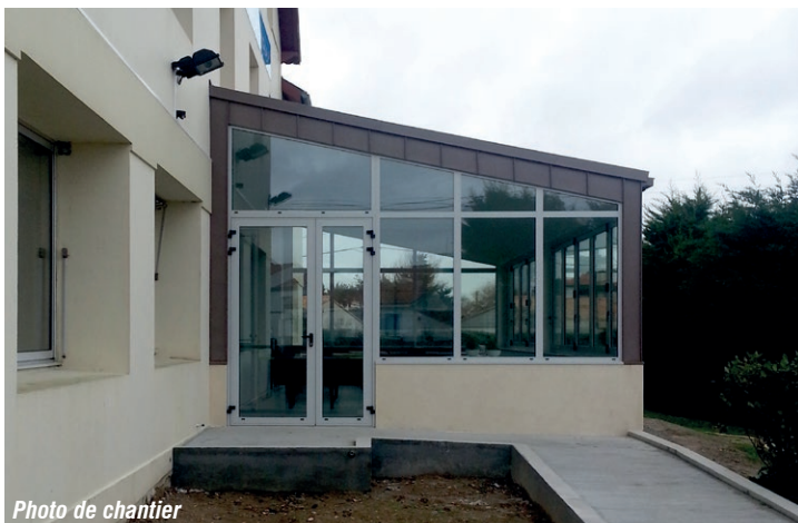
Photo de chantier